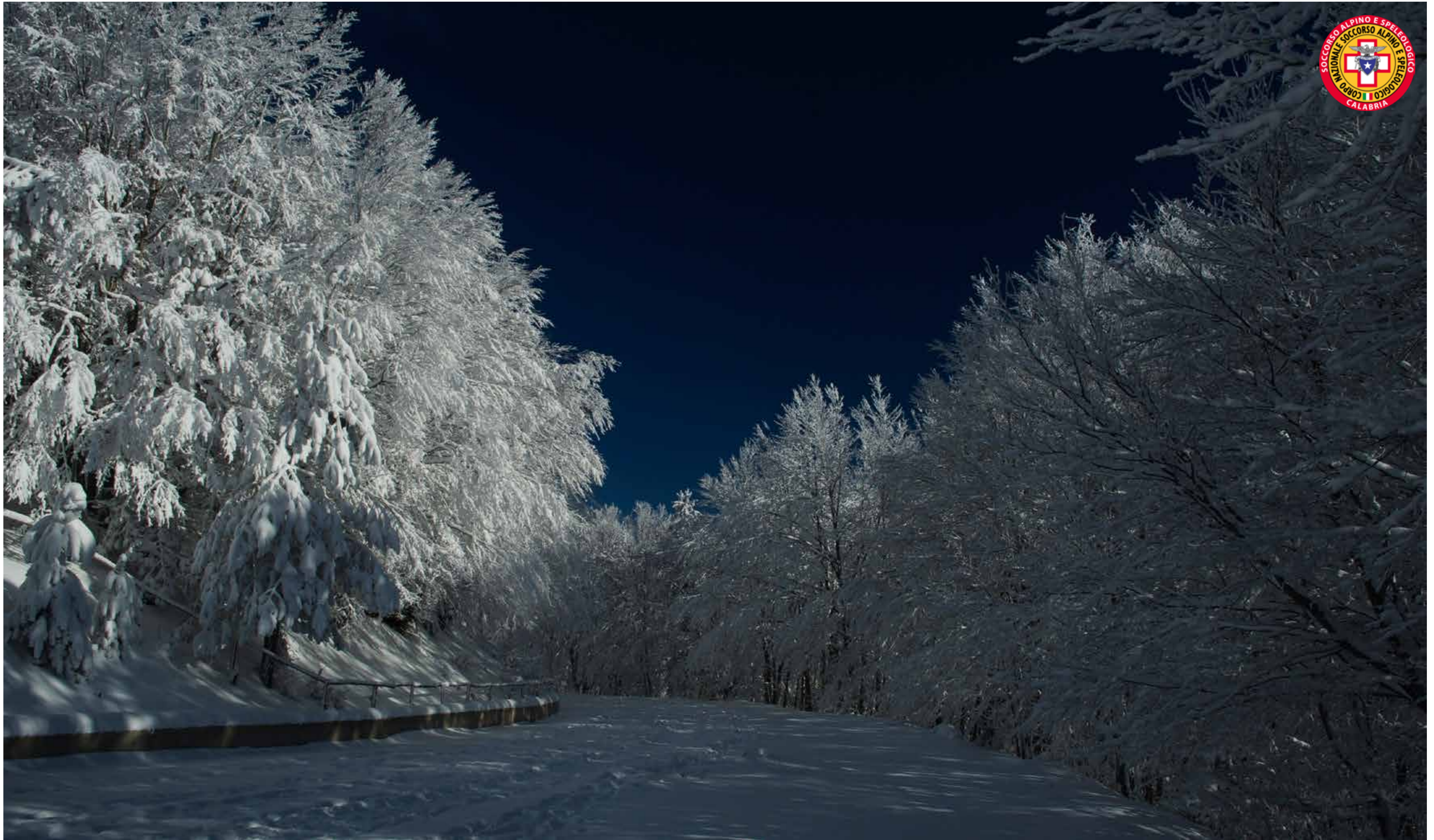
Parco Nazionale della Sila, Monte Scuro verso Serra Stella