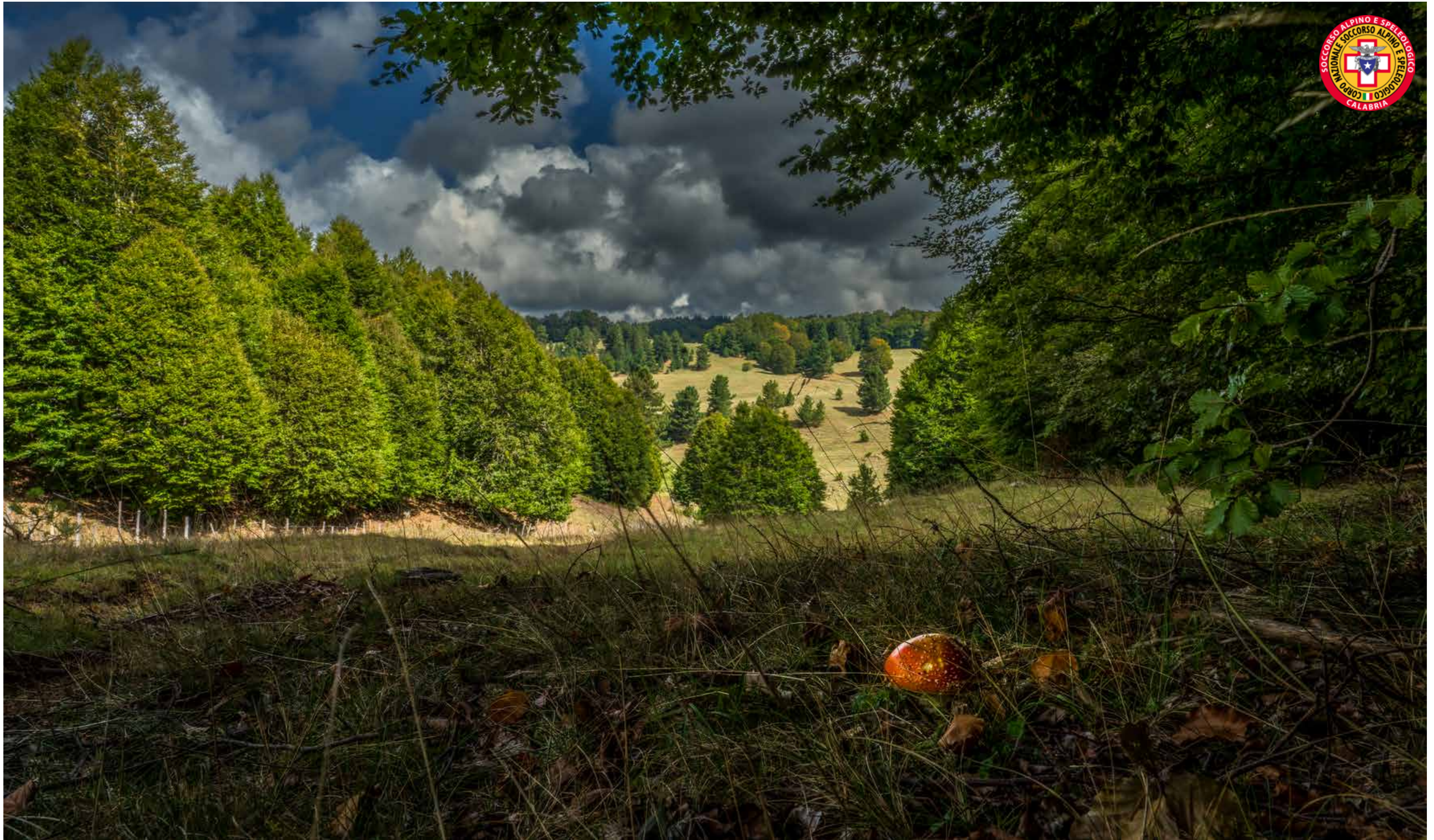
Parco Nazionale della Sila, Val di Tacina - Sila Piccola