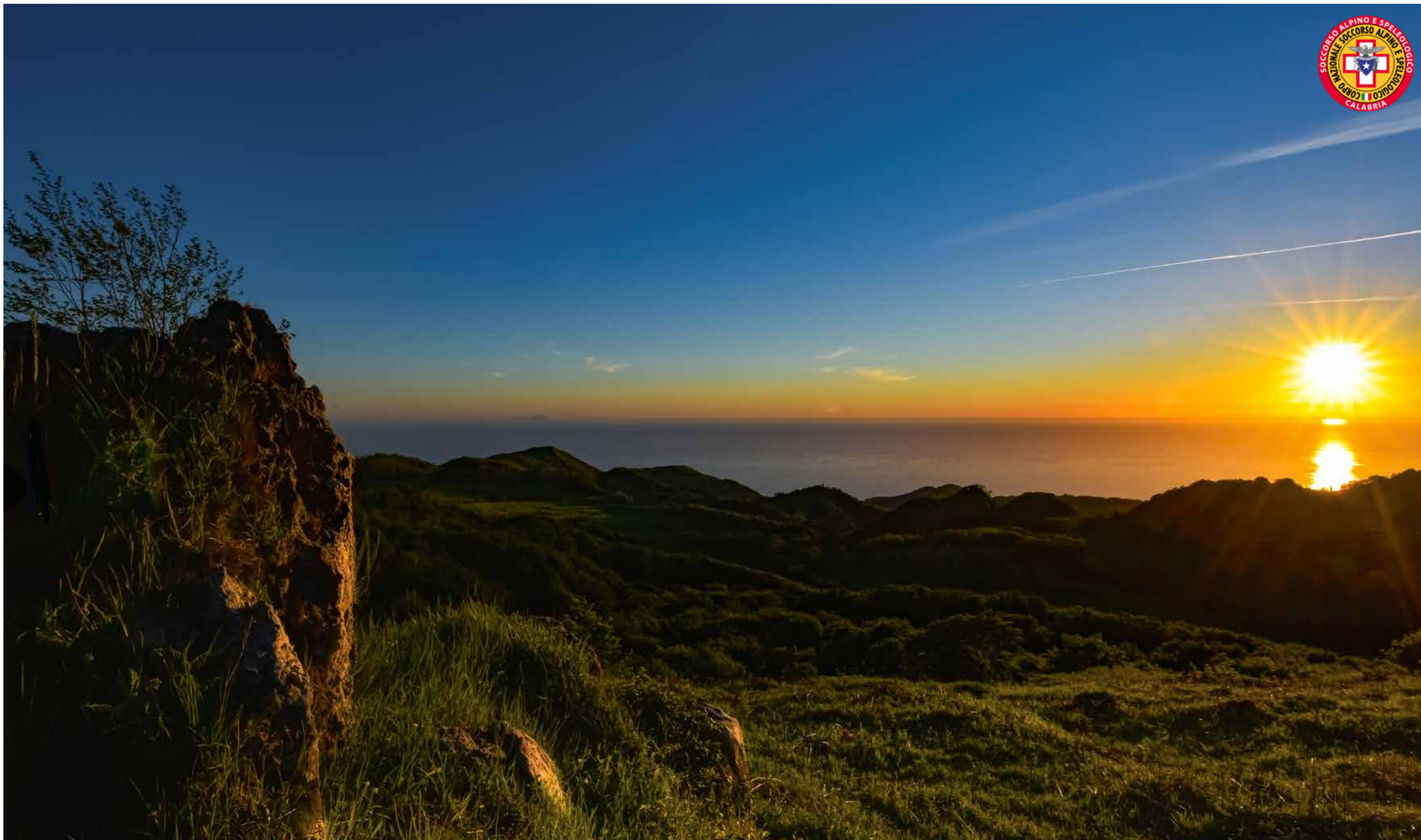
Catena Costiera, lungo il Sentiero Italia - CAI (Club Alpino Italiano)