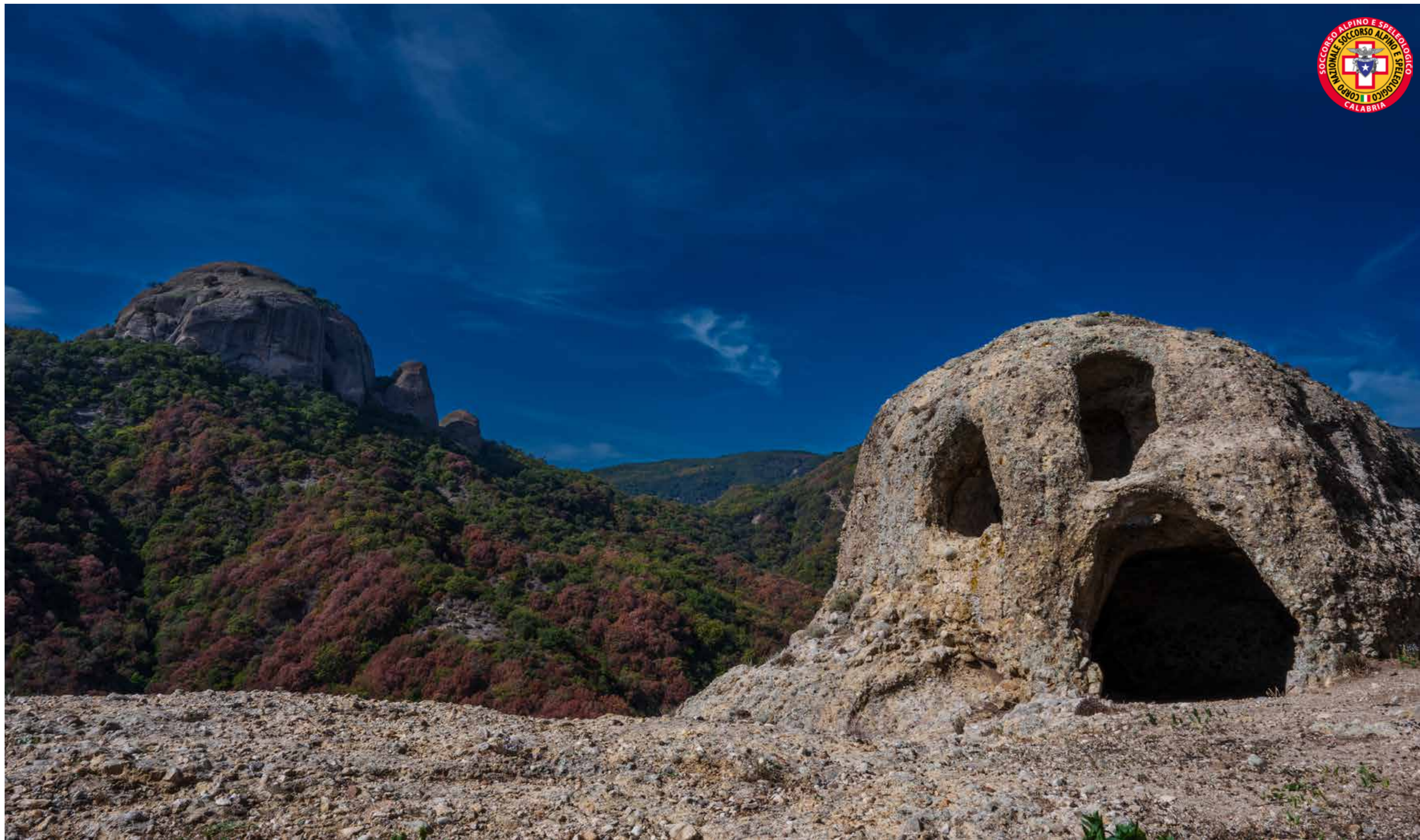
Parco Nazionale d'Aspromonte, rocce di San Pietro e sullo sfondo Pietra Cappa